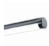
BETA p. 344