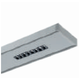
TESIS p. 250