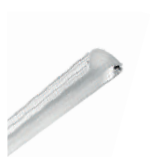
RIFT p. 60