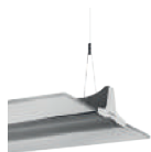
EIFFEL p. 32