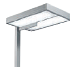
TESIS PIANTANA p. 282