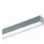
QUASAR p. 228