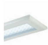
PLANET ECLISSE ASTRO p. 286