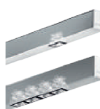
SISTEMA 9 p. 72