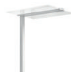
EIFFEL PIANTANA p. 44