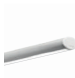
MINIVEGA p. 162