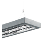
BRICK p. 222