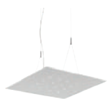
FOLIO p. 50